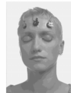
Abb.: Messung der Muskelspannung von der Stirnmuskulatur

Auf spielerische Art und Weise Lernen Sie so, die Verspannungen im Schulter-Nacken-Bereich zu lösen und damit die Kopfschmerzen zu reduzieren.